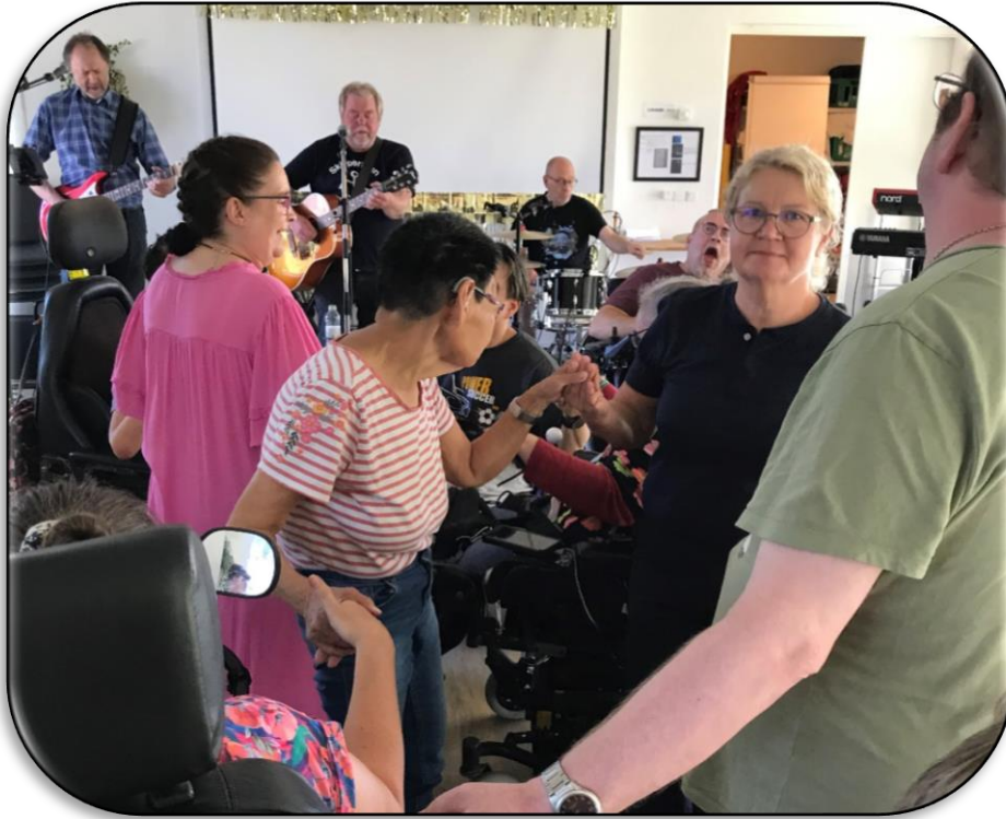
Et fyldt dansegulv!

Tak for en rigtig god musikfestival. Speciel tak til husorkestret, magneten og hat & CO for den festlige musik.