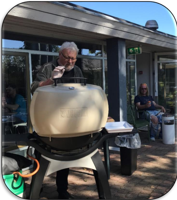
Ole stegte pølserne under en blå himmel.