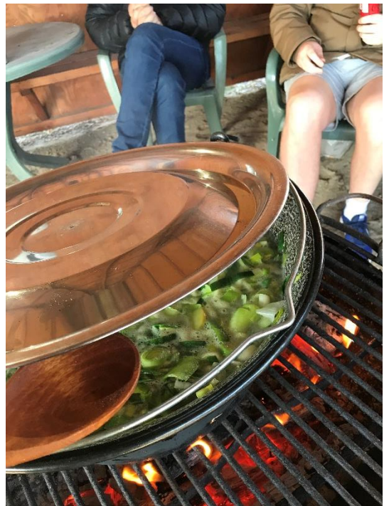
Dejlig suppe og endnu dejligere ben.